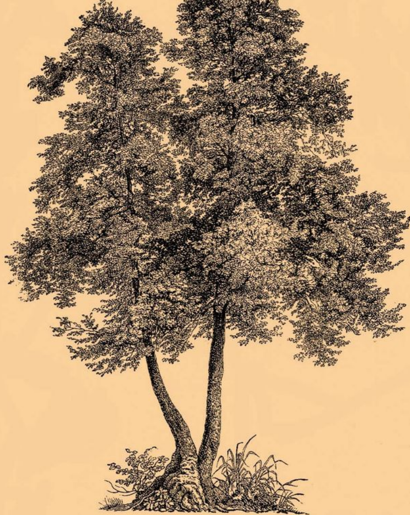
1. Ольха черная ( Alnus glutinosa ).